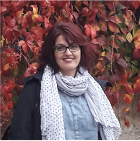
NURDAN ELLEZ WINDMILL EĞİTİM DANIŞMANLIK

Birlikte böyle bir yolculuğa çıkmak istiyoruz. Az laf çok iş, az söz çok yazı. Gelin yazarak kendimizi daha iyi ifade edip etki alanımızı genişletelim.