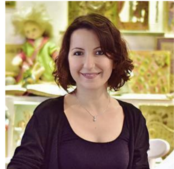
BERİL ERBİL YAZI ÇİZİ ÇEKİ ATÖLYESİ

3 MODÜL 26 SAAT 20 KATILIMCI KATILIM BELGESİ